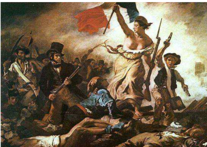
Delacroix: A szabadság vezeti a népet ( http://enciklopedia.fazekas.hu/index2.htm )