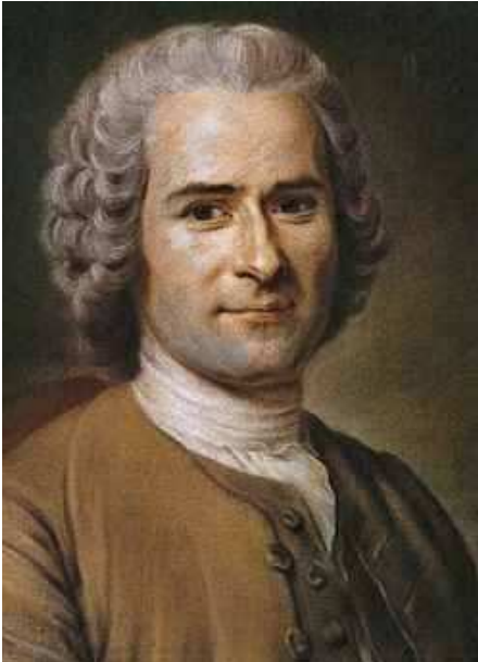
Rousseau portréja http://hu.wikipedia.org/wiki/Jean-Jacques_Rousseau