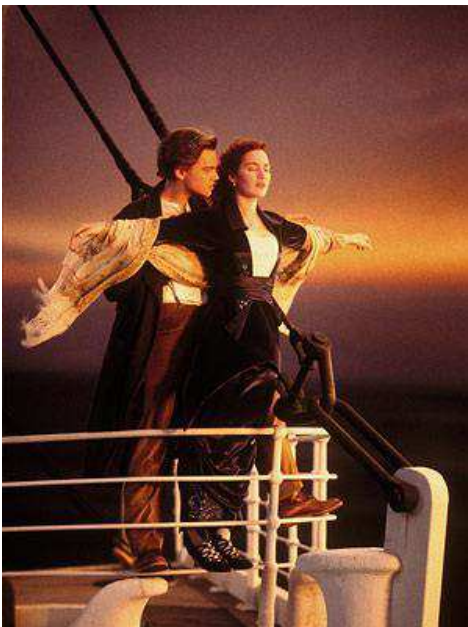
Részlet a Titanic c. filmből. ( http://rozsaszin-parduc.blogspot.hu/2012/04/repulok.html )