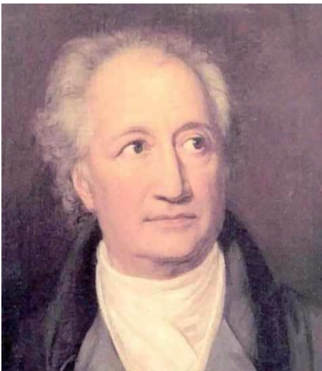
Goethe portréja ( http://enciklopedia.fazekas.hu/index2.htm )