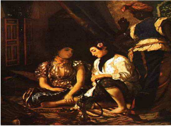
Delacroix: Algériai nők ( http://enciklopedia.fazekas.hu/index2.htm )