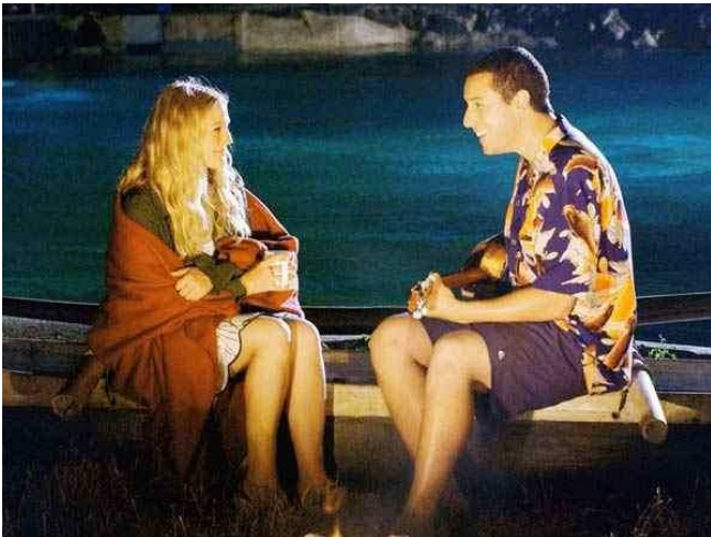
Részlet az 50 első randi c. filmből ( http://www.kiskegyed.hu/galeria/915 )