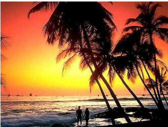
Hawaii naplemente ( http://www.tropusiu tazas.hu/tropusi_kepek_tropusi-naplemente_113.html )