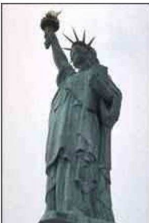
Bartholdi: Szabadság ( http://enciklopedia.fazekas.hu/index2.htm )